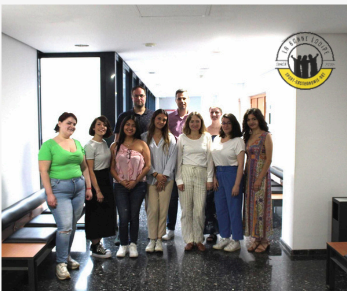
Rencontre des partenaires à Valence, juin 2024

À l'occasion de la clôture du projet Facteur vert, nous souhaitons exprimer notre gratitude à tous les participants, partenaires et collaborateurs qui ont pris part à cet incroyable voyage. Grâce à nos initiatives, nous avons pu créer un impact positif sur les communautés et fournir des outils précieux aux jeunes et travailleurs de jeunesse. Bien que ce projet touche à sa fin, l'héritage de Green Factor perdurera grâce aux liens et aux connaissances partagées! 🌱❤