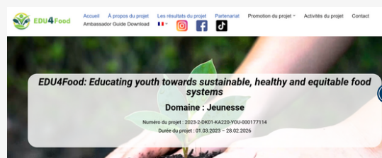
Capture d'écran de la page internet du projet

La prochaine étape du projet consistera au développement de la plateforme numérique du projet.