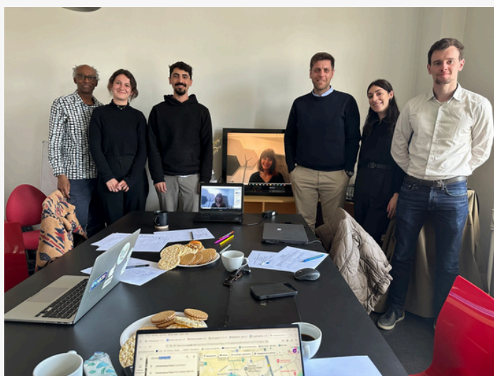
Membres du consortium du projet lors de la première réunion du projet à Copenhague en Avril 2024

Le projet EDU4Food vise à sensibiliser les jeunes aux systèmes alimentaires durables, à promouvoir une alimentation saine et favoriser l'emploi des jeunes dans l'industrie alimentaire.